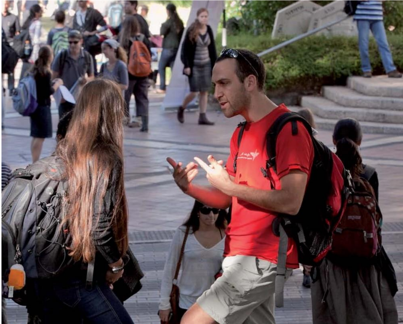
巴依兰大学生机勃勃的校园